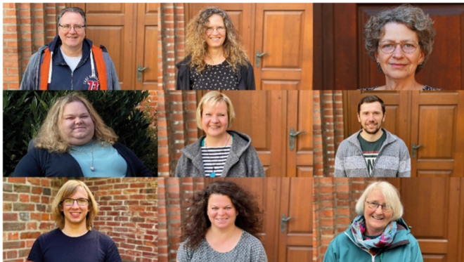
Die neue MAV des Kirchenkreises Winsen.