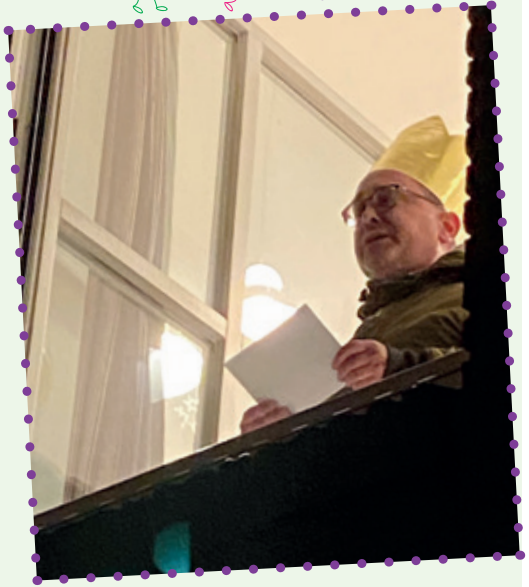
Die „Teamer“ der St.-Jakobi-Kirchengemeinde